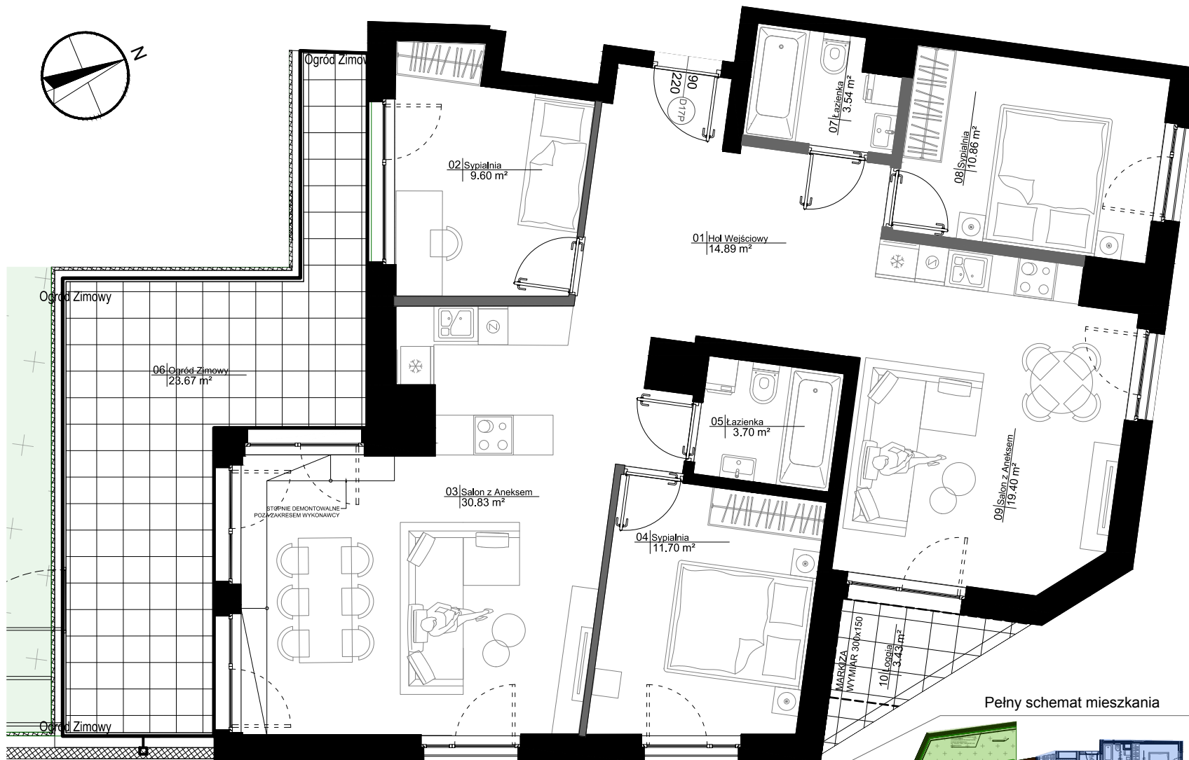
Pełny schemat mieszkania